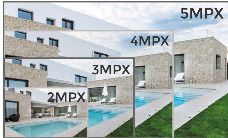
*Referencia de Imagen